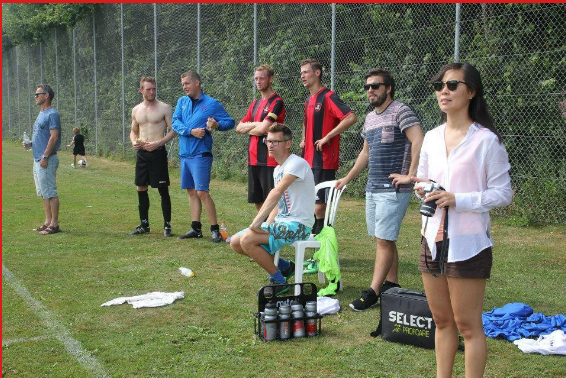
De, som ikke spillede, slappede af på linjen.