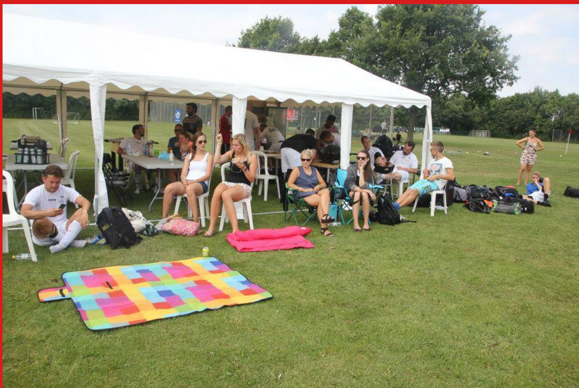
Eller ved teltet, hvor der var godt gang i salg af mad og drikke.