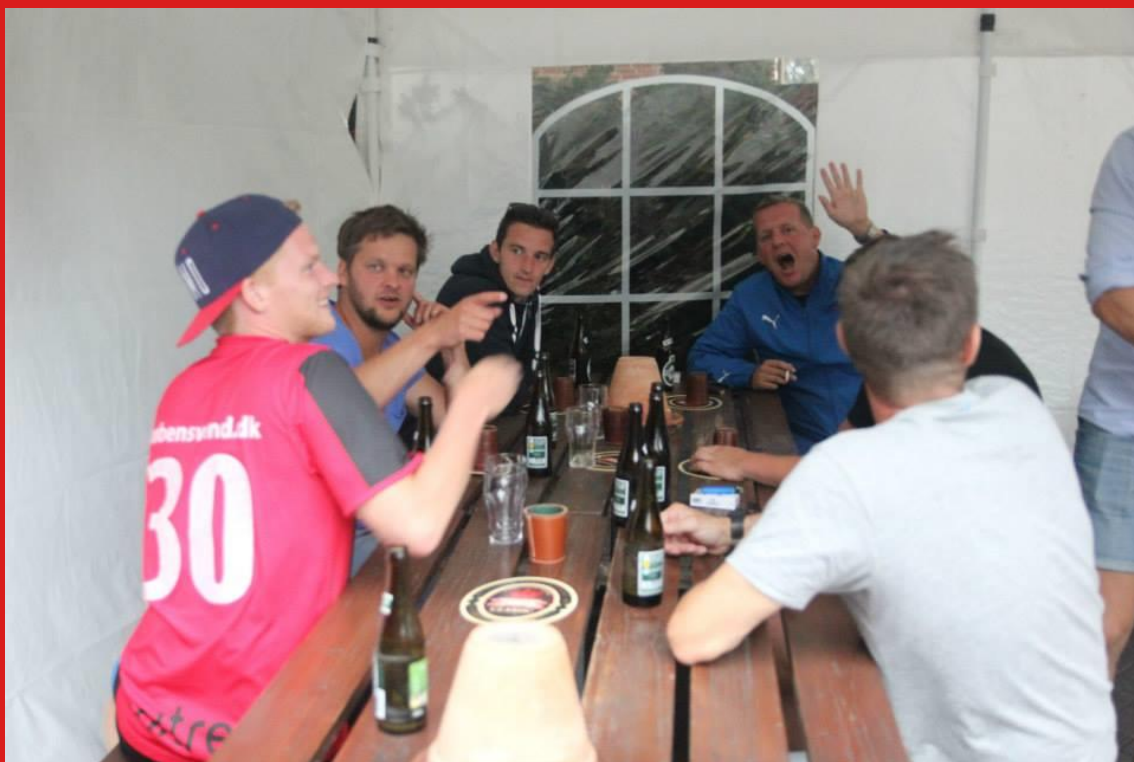
Og efter lang dag med kampe, var det tid til øl. Først på pladsen, i teltet.