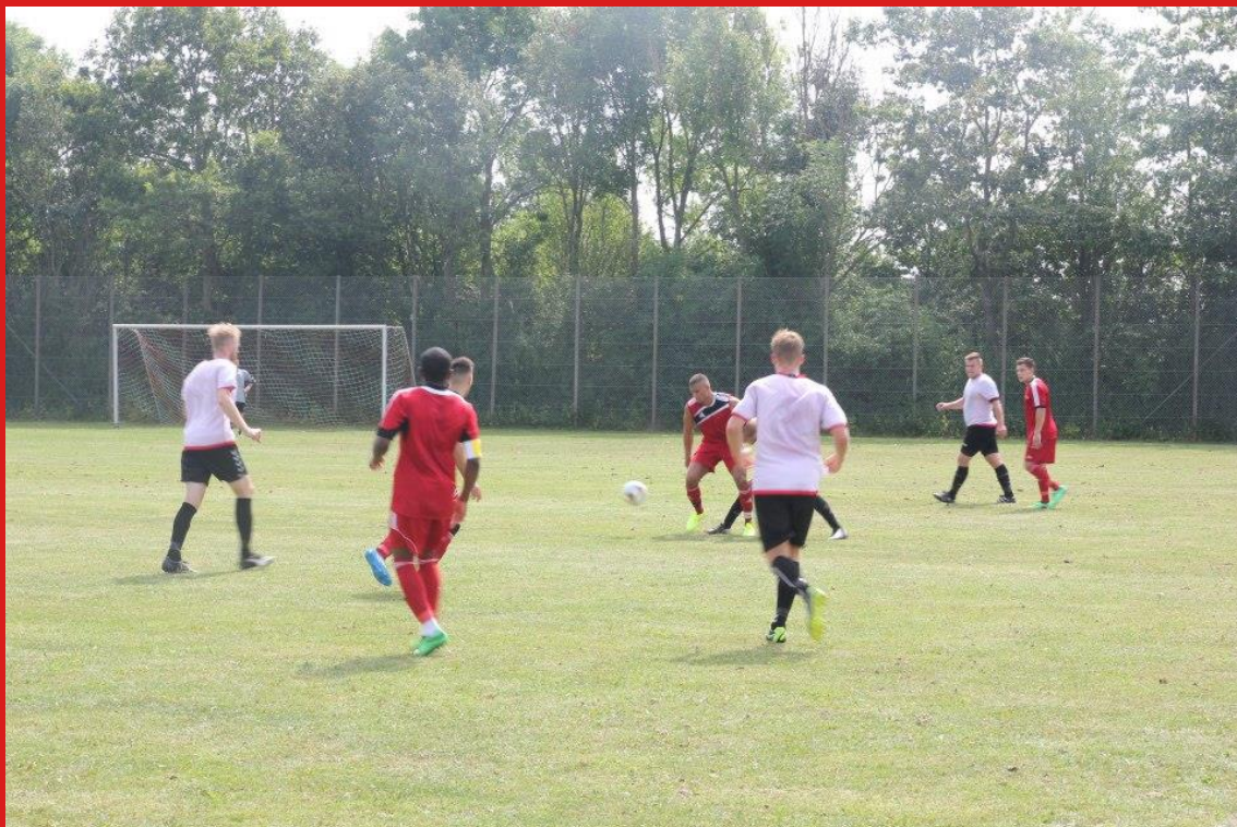
Førsteholdet spillede også på dagen. Her mod de gamle kendinge fra Vatanspor.